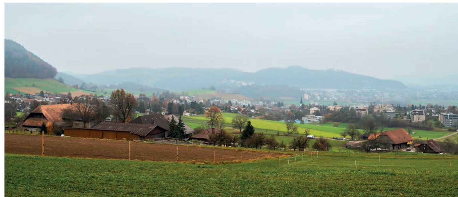
Blick auf Bolligen ab Wysshuus