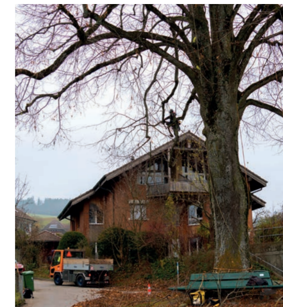
Baumschnitt und Grünpflege