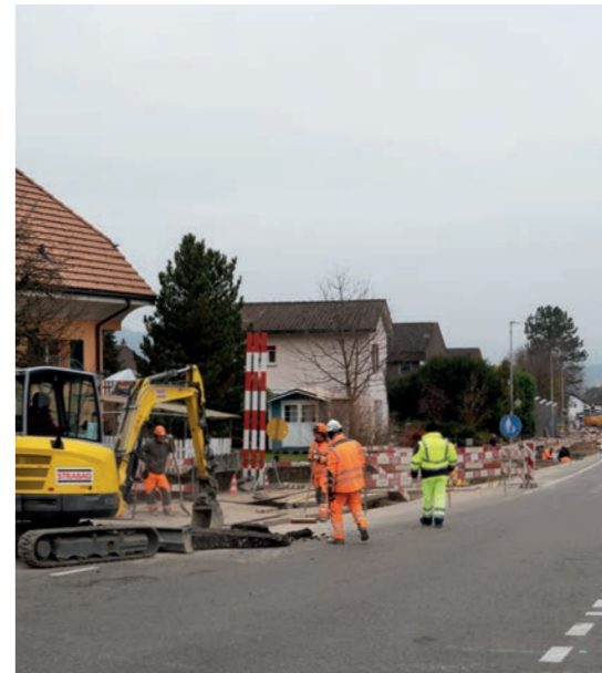
Neue Wasserleitungen an der Krauchthalstrassestrasse