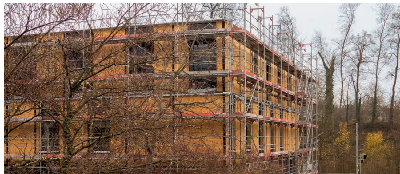
Neubau Musikschulhaus Bolligen