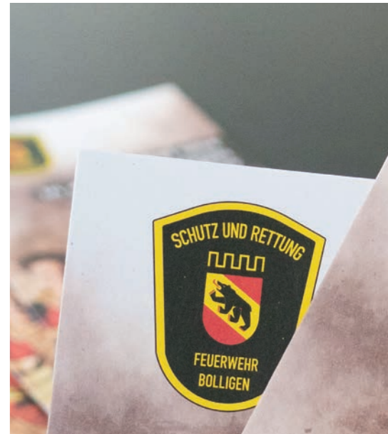
Das neue Logo der Feuerwehr Bolligen