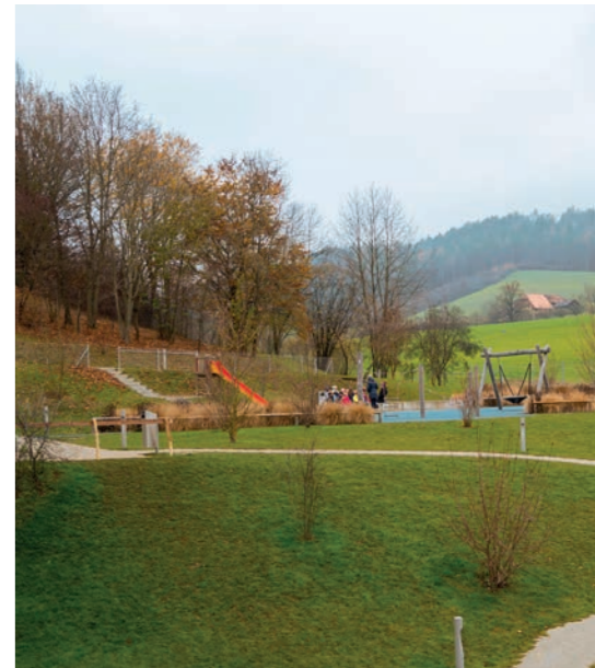
Spielplatz bei der Schulanlage Luteretal