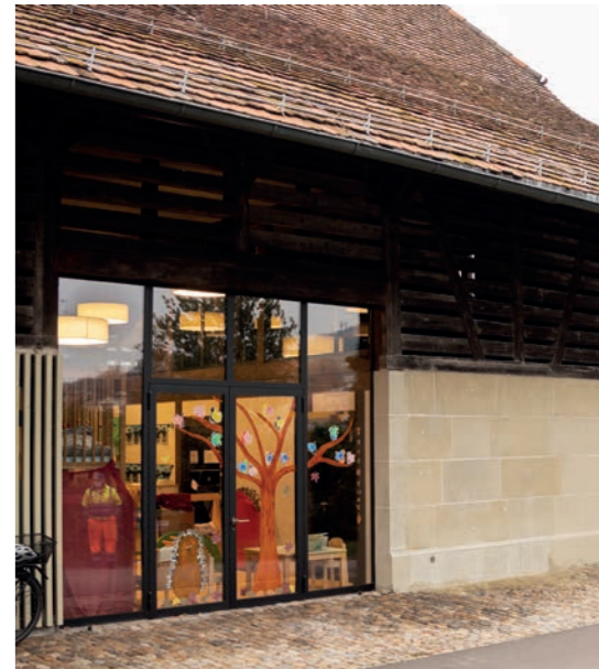
Neuer Kindergarten Pfrundschiür