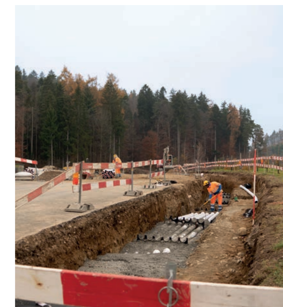
Baustelle Reservoir Mannenberg des Wasserverbunds Region Bern