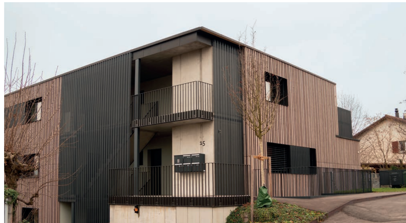
Neubau an der Brunnenhofstrasse