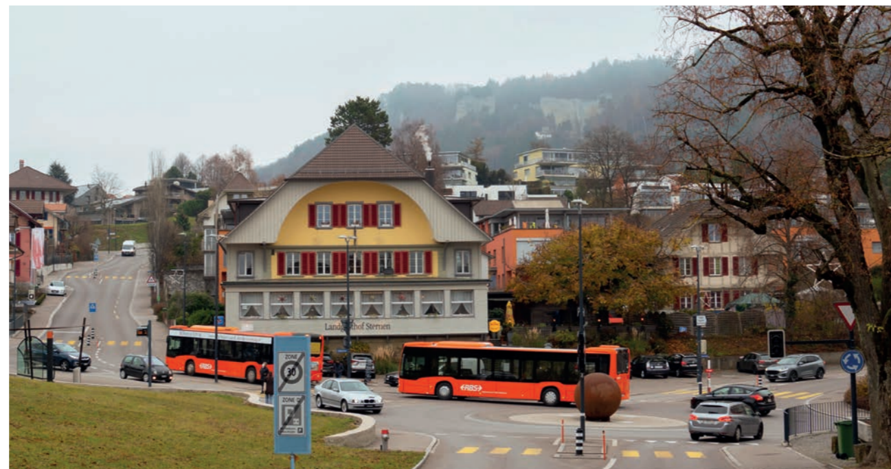
Kreisel beim Restaurant Sternen