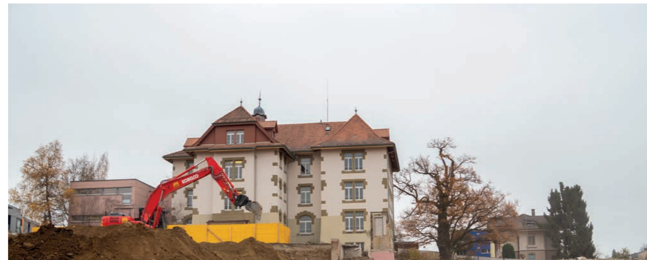
Altes Schulhaus Flugbrunnenstrasse 16