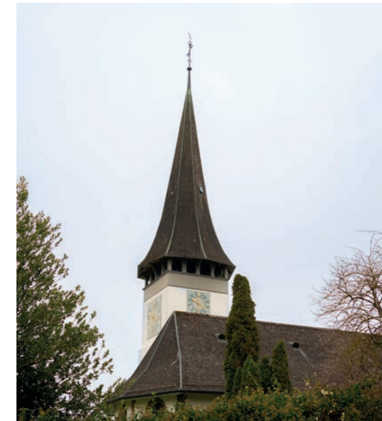
Evangelisch-reformierte Kirche Bolligen