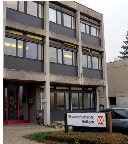
Aktueller Standort Gemeindeverwaltung