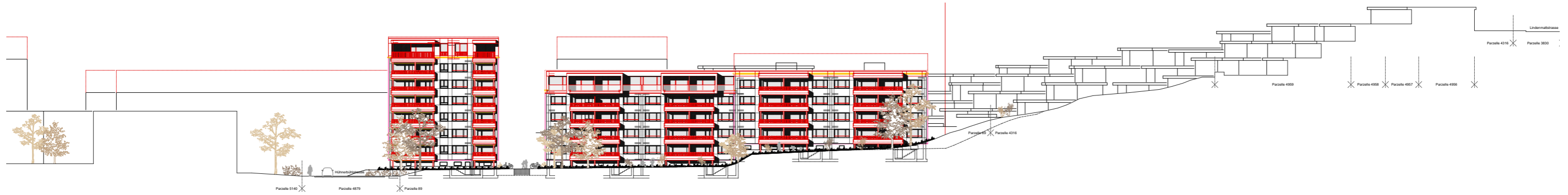
Terrainschnitt 3 Ost - West