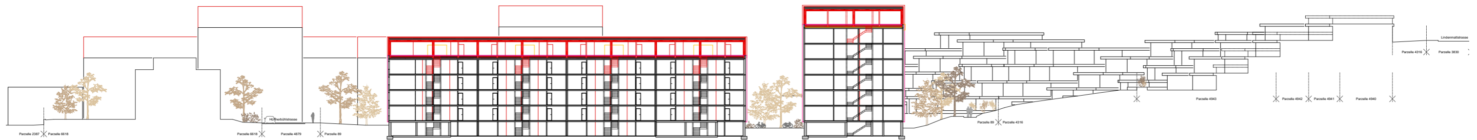
Terrainschnitt 2 Ost - West